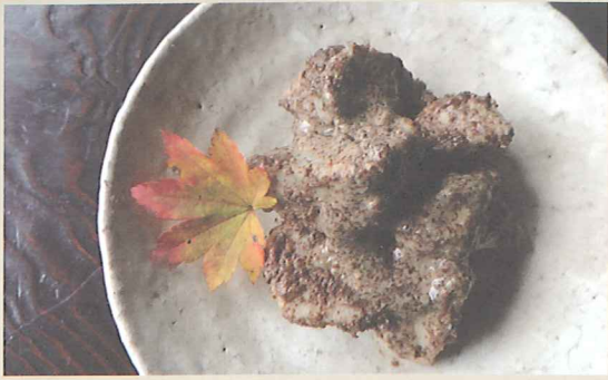
親芋(サトイモ)の じゅうねん和え

サトイモの親芋は大きい粘りが少ない。食べきれずに土に返すこともあるが、掘りたての親芋は蒸すとほっこりとして繊維質が気にならなくなる。一口大に切って蒸した親芋を、たっぷりのじゅうねん味噌(じゅうねんを軽く煎って丁寧に摺り、味噌・醤油・みりん・砂糖・酒で練る)で和えるだけ。