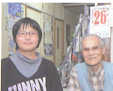
写真・文責:菅 敬浩

※只見線の線路が分断されていることについて武勇さんは「乗る人は少なくても、病院とかに行く人にとつては欠かせない大切な路線です」