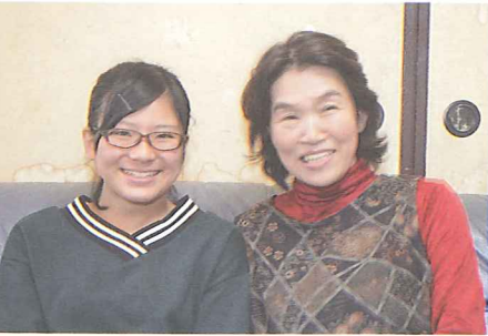
写真・文責:菅 敬浩

Q:この写真を選んだ理由は? 有沙さん:今道路が新しくなってるから、昔の道路のことはわがんだと思っ