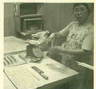
▲一回に1.5kを打つ。同じ品質を保つように努力しています。喜んでもらえるのがうれしい。