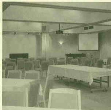
▲結婚式もできるホール。