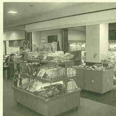
▲各町村の物産が並ぶ。