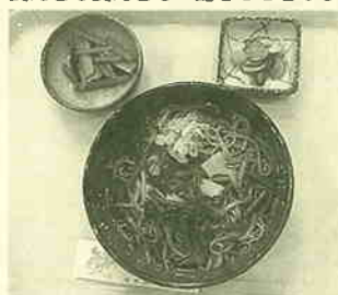
▲南郷・磐岩の地元産そば粉を石挽きして使用。