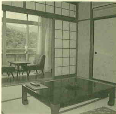
▲田園地帯を望む客室。