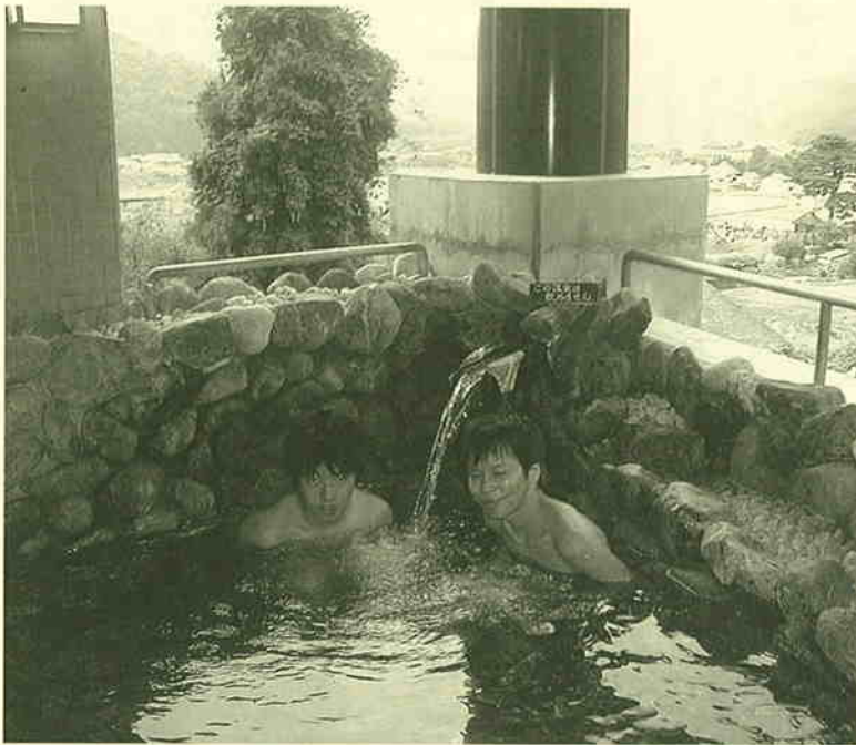
▲やわらかい泉質は、疲れを癒してくれる。

84名が収容できる18室の客室と大広間を持つさゆり荘は、展望露天風呂や多目的ホールを有するさゆり会館と廊下でつながっています。「さかい温泉」とも親しまれる露天風呂は、田園地帯を一望できる高台の、チャペルのような煙抜きの塔が目印。周辺の行楽地めぐりの憩いの宿として、また結婚式などの利用も多いさゆり荘・さゆり会館は、あたたかな交流の場となっています。