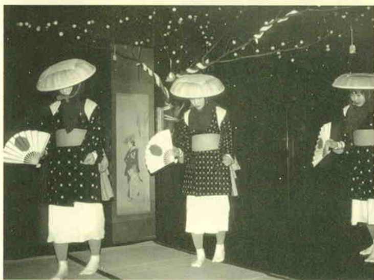
早乙女踊り（南郷村）

椒の葉、もち米ご飯と糀を使って1カ月以上も漬けたら、山椒のほのかな香りと、まろやかな酸味と熟れた塩味、しなやかに変わった身欠きニシンに変身。軽く焼いて正月の年始客へのもてなし料理に出されます。酒肴にぴったり。