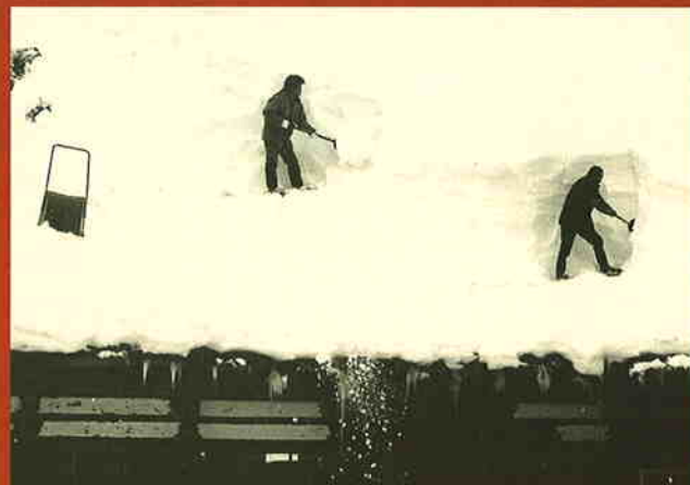
《雪を掘る》 奥会津では屋根の雪も掘るのです。