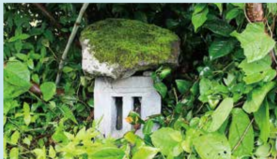
2つの窓がある上町の道路沿いにある水神と山神

② 只見の街路には水路が巡らされ、その上町のかつて鹿島と呼ばれていた場所の水神・山神石祠はユキツバキのなかにあった。この祠にも2つの窓がある。