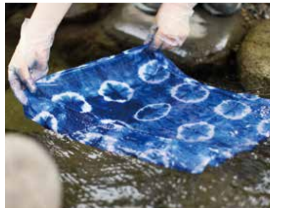
藍染体験はGWから9月末(今年は12日)まで。要予約

南会津町では200年以上前から藍染が行われており、明治から昭和初期には町内に16軒の染屋があったという。会津田島祇園祭に着る麻の袴地を染める役割も担ってきたが、現在はほとんど残っていない。奥会津博物館では平成16年(2004)の開館当初から藍染文化の継承に取り組み、「田島藍染保存会」と協力して藍の栽培や藍染体験事業などを行っている。染屋の土間には染料が入った石造の藍甕(あいがめ)が並び、歴史を感じながらハンカチや手ぬぐいの絞り染めを体験できる(1,000円~)。絞り染めの仕上がりは十人十色。2時間ほどで世界に一つだけの美しいジャパンプルーが完成するので、ぜひお試しあれ。