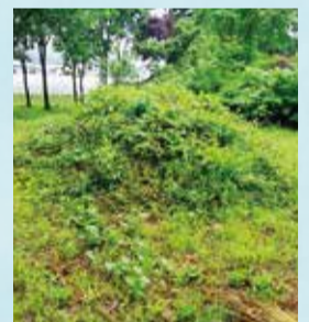
川除け地蔵の背後の石塚