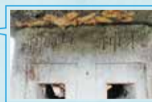
左に山神、右に水神(赤布の下には二つの窓)