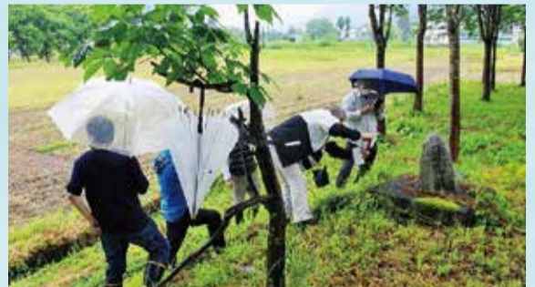
地蔵尊の下段には美しい広葉樹の林がある