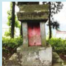
正面は赤い布で覆われている

② 只見の街路には水路が巡らされ、その上町のかつて鹿島と呼ばれていた場所の水神・山神石祠はユキツバキのなかにあった。この祠にも2つの窓がある。