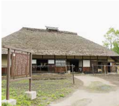
江戸時代創業の染屋。最盛期は町内に16軒あった