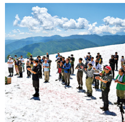
図 尾瀬檜枝岐温泉観光協会 TEL 0241-75-2432

登山口で先着500名に登山バッジ配布や赤飯・お神酒 の振る舞いを実施。10:30頃からは駒の大池付近で駒 形大明神安全祈願祭を開催します。