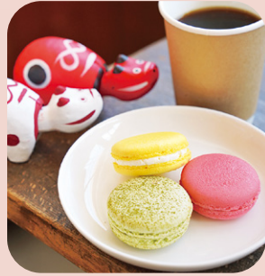
パティスリー塔之坊のマカロン

cafe あいべこでは、若手製菓技術者の国際大会で優勝した経歴を持つ柳津在住パティシエールが作った「パティスリー塔之坊のマカロン」などを味わうことができます。