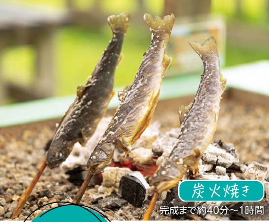
炭火焼き 完成まで約40分～1時間